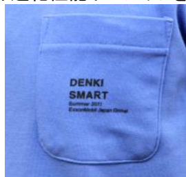
「DENKI SMART」のロゴが入った吸汗速乾性能ポロシャツを着て勤務する社員(本社オフィス)